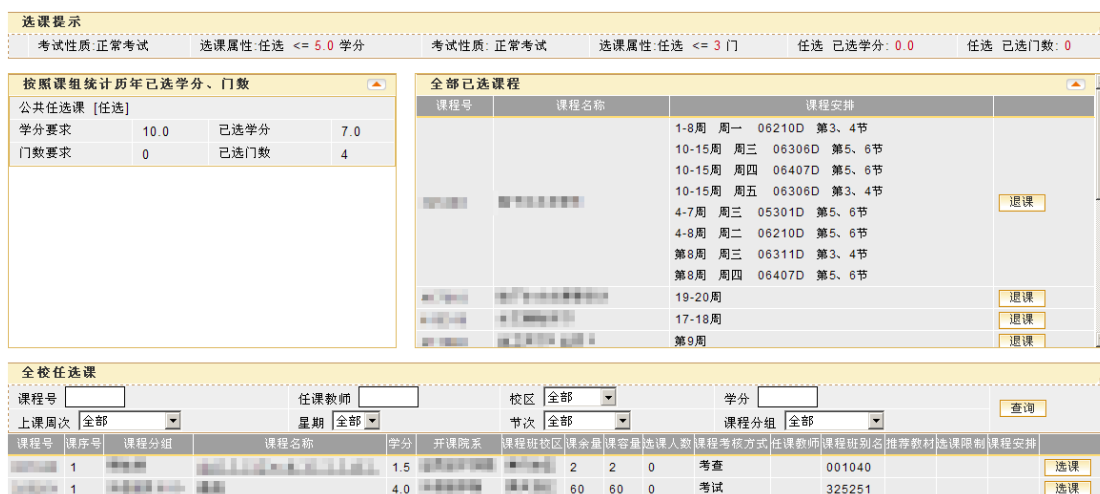
图 2 任选选课