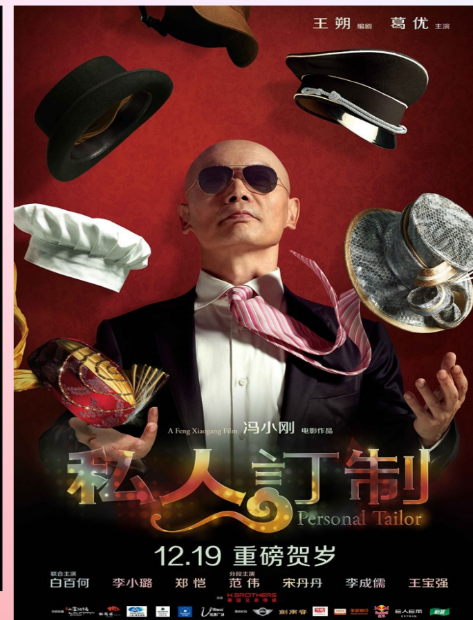
私人订制 Personal Tailor (2013)