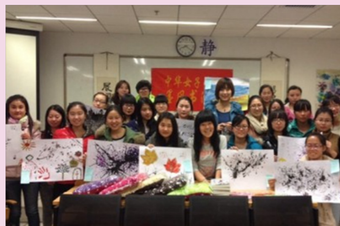
11月30日吹墨创意涂鸦大赛圆满举行。