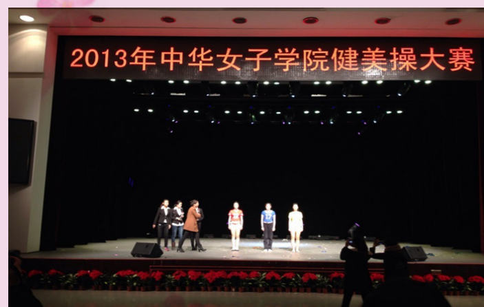
11月26日中华女子学院健美操大赛顺利举行，管院喜得第三名。