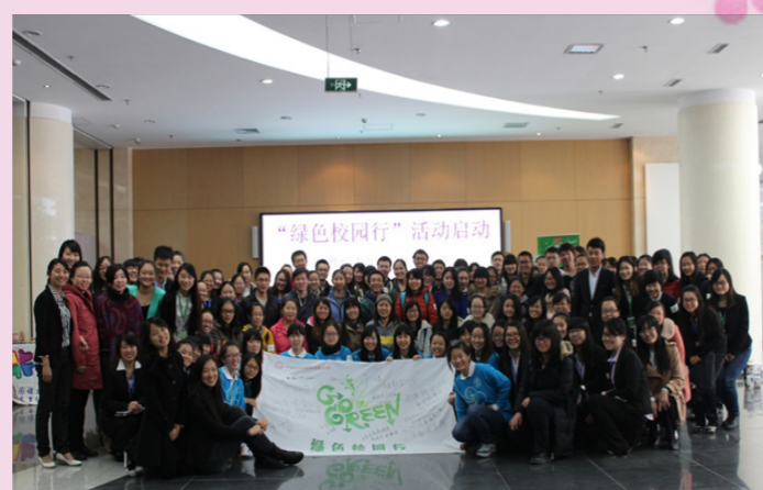
11月16日中华女子学院“绿色校园行”活动启动仪式圆满成功！