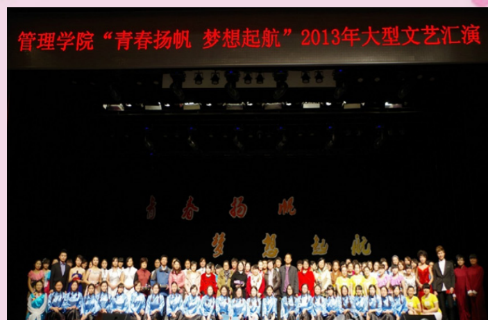
12月3日管理学院“青春扬帆 梦想起航”2013年大型文艺汇演圆满举办。