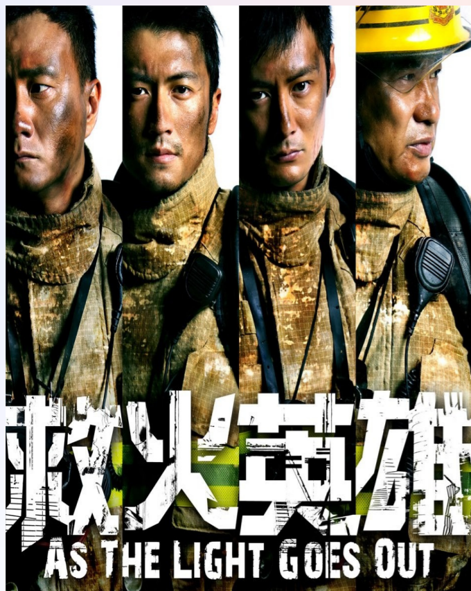
救火英雄 As The Light Goes Out (2013)

导演：郭子健 主演：谢霆锋 / 余文乐 / 胡军 类型：动作剧情冒险 地区：中国 中国香港